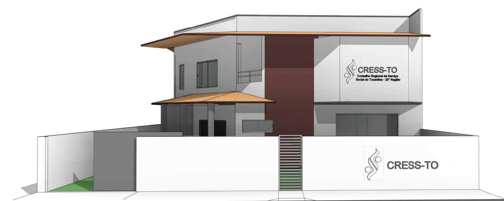
PERSPECTIVA 03 ESCALA: