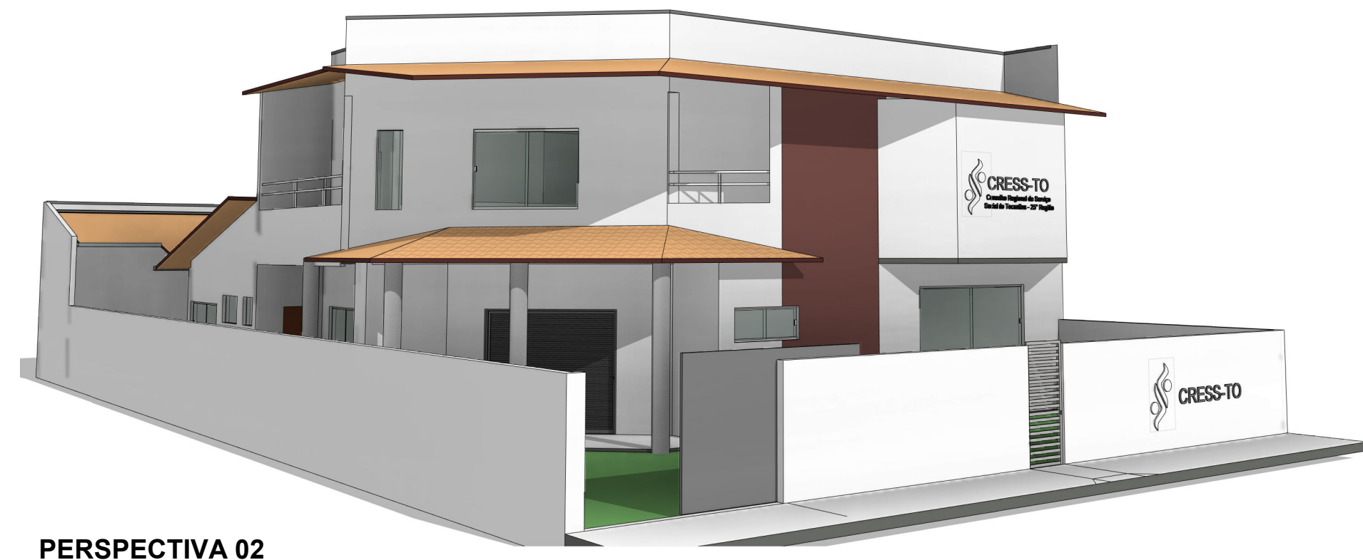
PERSPECTIVA 02 ESCALA: