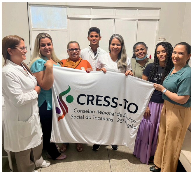
PROFISSIONAIS DO HOSPITAL REGIONAL DE GUARAI RECEBERAM O CONSELHO PARA ORIENTAÇÕES PROFISSIONAIS