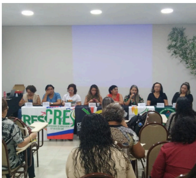
PRESIDENTE REPRESENTA CRESS-TO NO X FÓRUM DA COFIS - REGIÃO NORTE