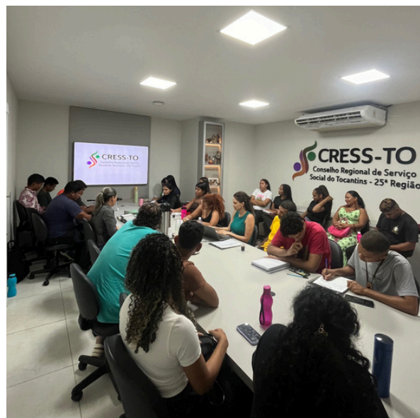
Alunos da UFT